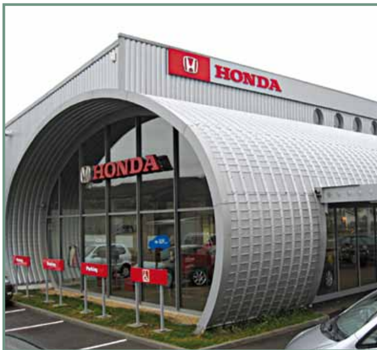
> HONDA (Bourg-en-Bresse, 01)