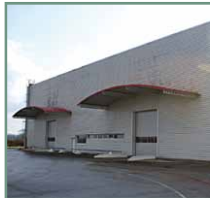
> PROFIL C - Auvent hall (Vaudrey, 39)