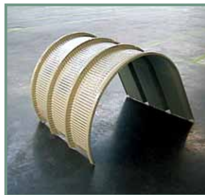
> Exemple de cintrage